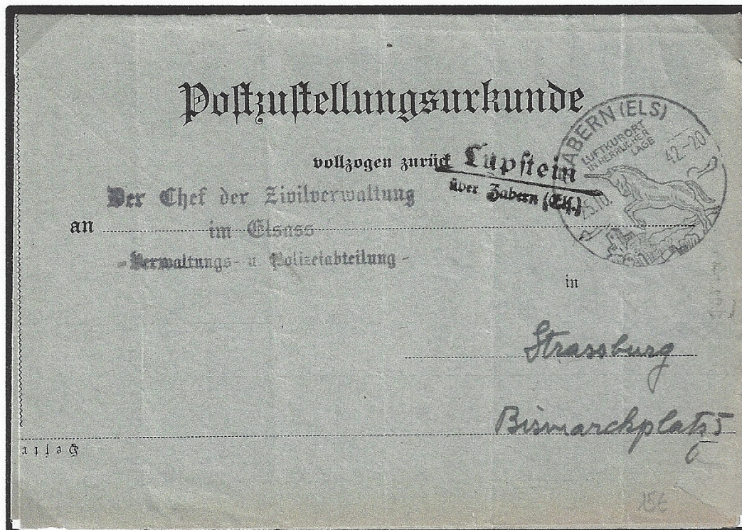
Certificat de livraison postale retourné sans timbre avec un cachet de l'agence auxiliaire de poste de Lupstein (type 324) au chef de l'administration civile en Alsace (section service administratif et de police) à Strasbourg (Bas-Rhin) et oblitéré le 25.10.42 avec le cachet de propagande de Saverne.