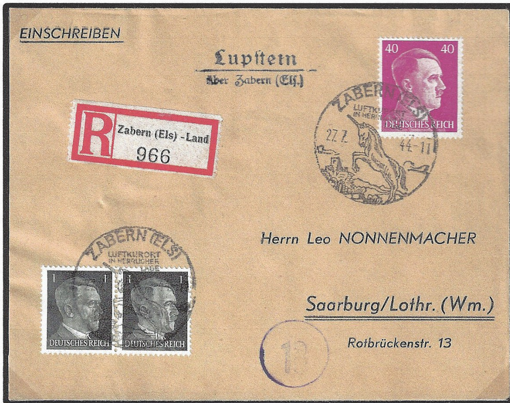
Lettre recommandée envoyée avec un cachet de l'agence auxiliaire de poste de Lupstein (type 324), oblitérée le 27.07.44 avec le cachet de propagande de Saverne et adressée à un particulier résidant à Sarrebourg (Lorraine) au tarif exact de 42 Rpf pour l'intérieur du Reich. À noter le papillon de recommandation de Zabern (Els)-Land.