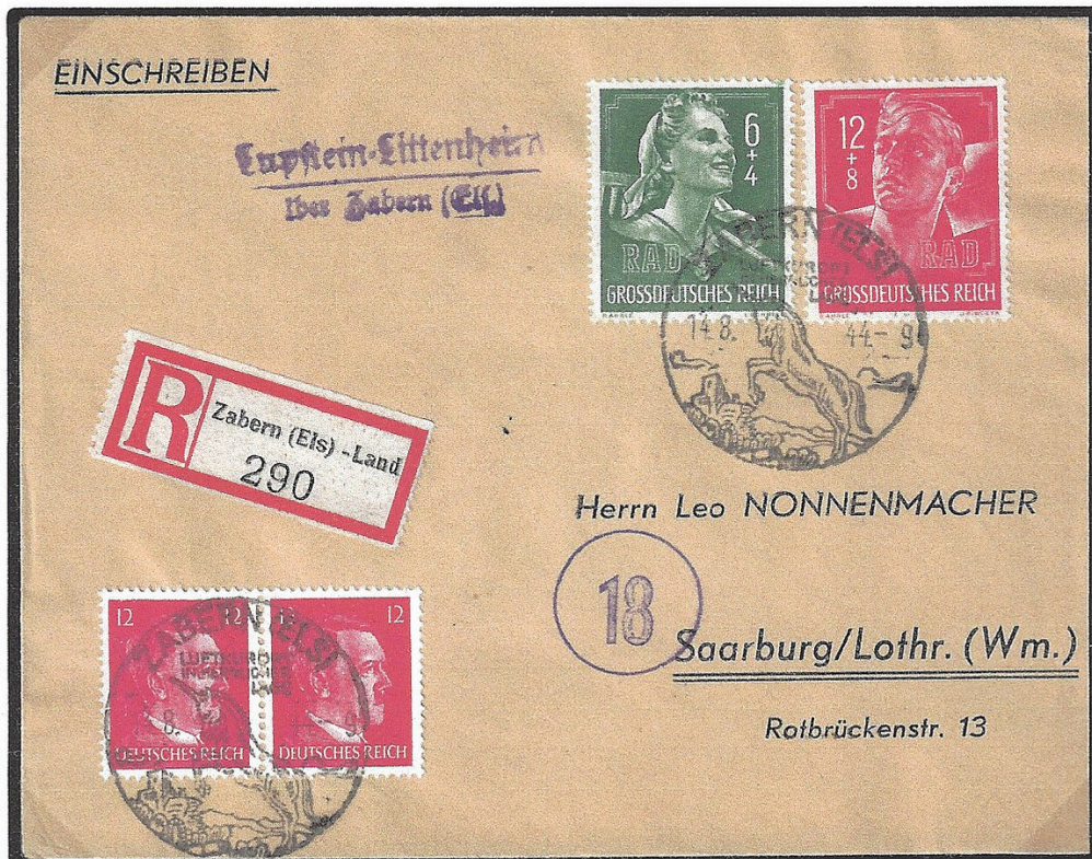
Lettre recommandée envoyée avec un cachet de l'agence auxiliaire de poste de Lupstein-Littenheim (type 324), oblitérée le 14.08.44 avec le cachet de propagande de Saverne et adressée à un particulier résidant à Sarrebourg (Lorraine) au tarif exact de 42 Rpf (intérieur du Reich). À noter le papillon de recommandation de Zabern (Els)-Land.

Agences auxiliaires de poste : Lupstein , Lupstein-Littenheim