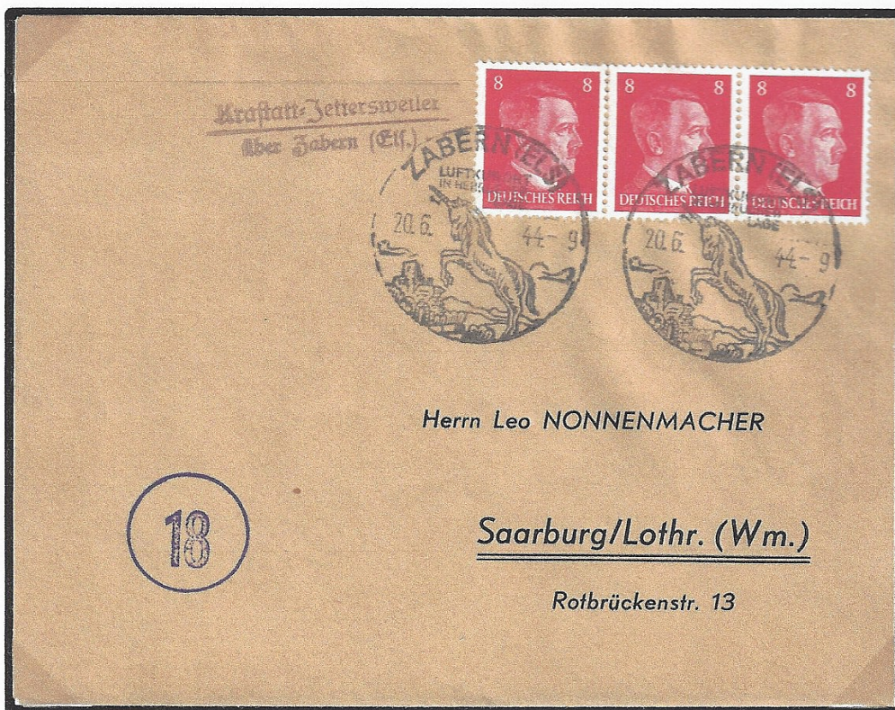
Lettre envoyée avec un cachet de l'agence auxiliaire de poste de Krastatt-Jetersweiler (type 324) et oblitérée le 20.06.44 avec le cachet de propagande de Saverne. Cette lettre a été adressée à un particulier résidant à Sarrebourg (Lorraine) au tarif exact de 24 Rpf pour l'intérieur du Reich (lettre de 20 à 250 g).