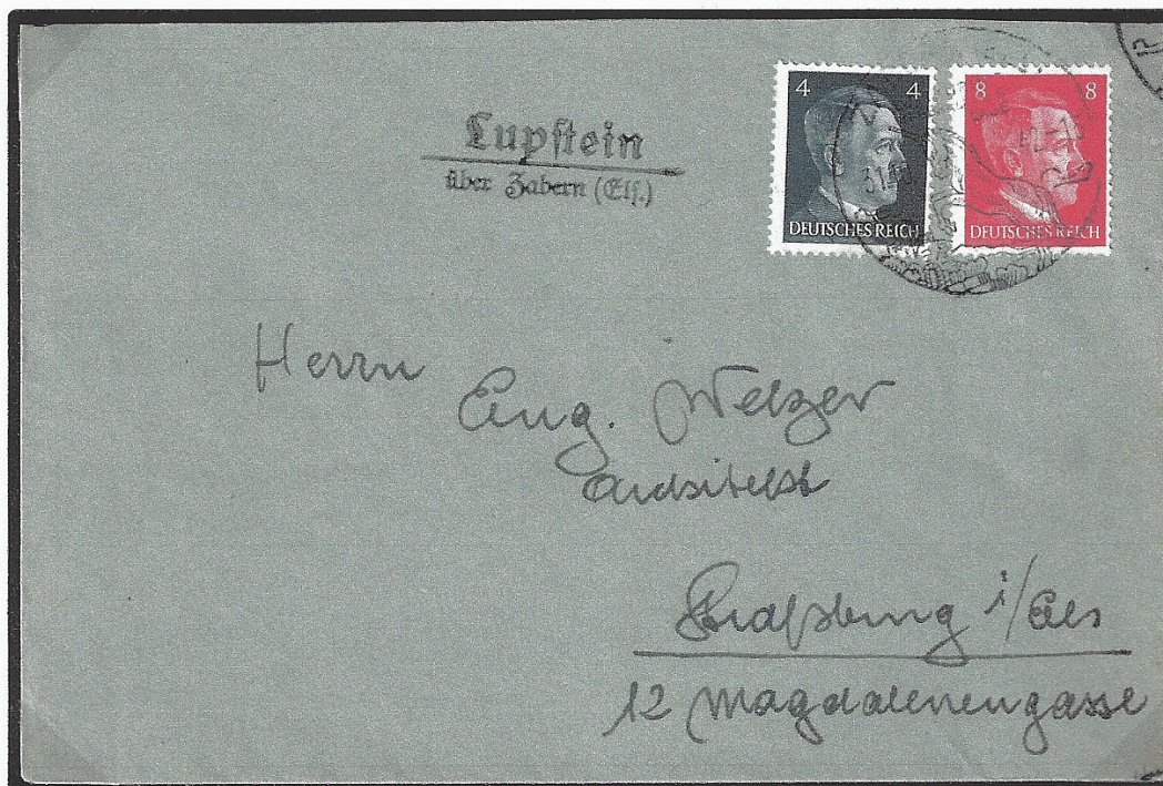
Lettre envoyée avec un cachet de l'agence auxiliaire de poste de Lupstein (type 324) et oblitérée le 31.10.42 avec le cachet de propagande de Saverne. Cette lettre a été adressée à un particulier résidant à Strasbourg (Bas-Rhin) au tarif exact de 12 Rpf pour l'intérieur du Reich.