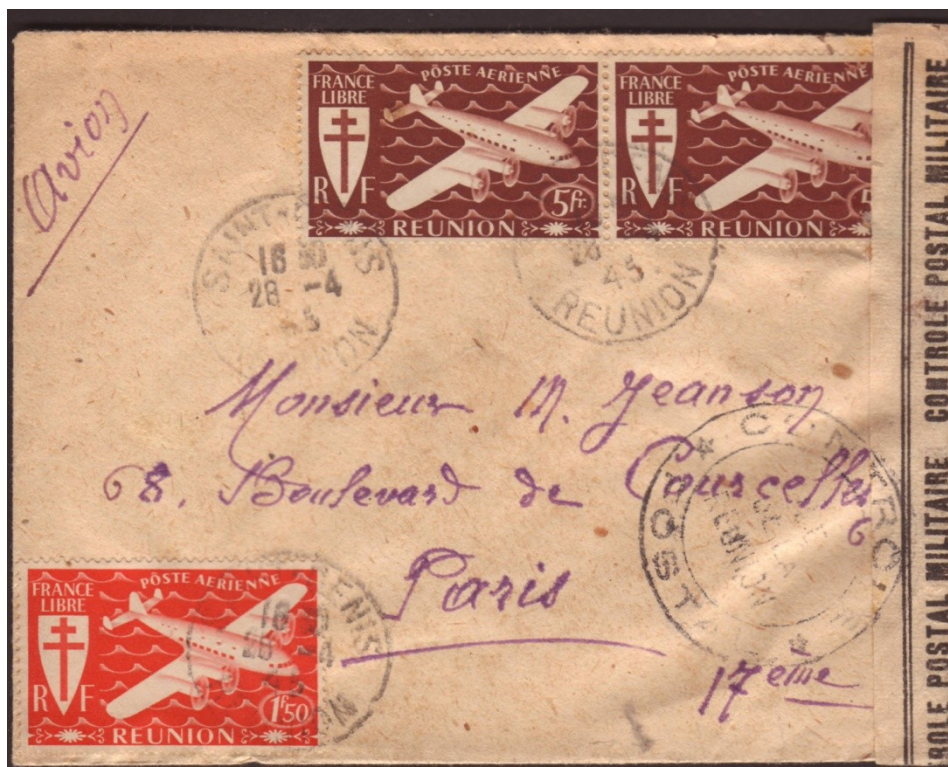
Lettre par avion de St Denis du 28 avril 1945 pour Paris affranchie à 11f50. Cachet de contrôle en noir.

Par cette lettre ce termine la censure en Réunion.