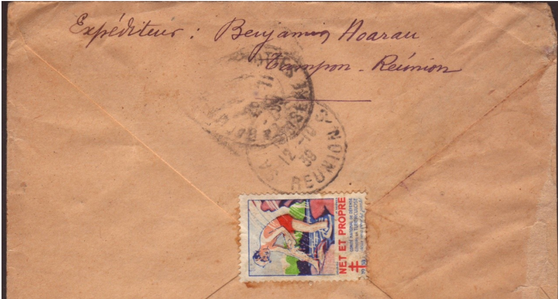
Arrivée a destination le 20 novembre 1939.