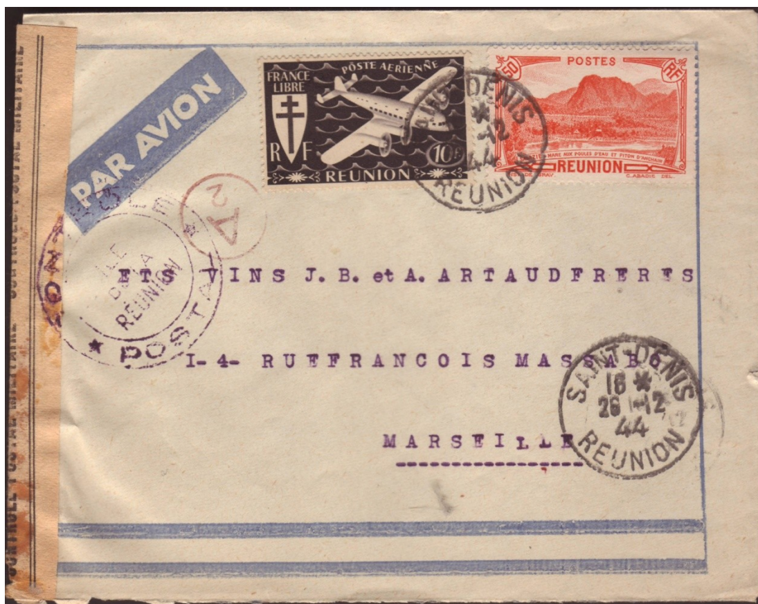
Lettre par avion de St Denis du 26 décembre 1944 pour Marseille, affranchie à 10f50. Contrôlée par le lecteur Nr. 2, cachet de contrôle en violet.