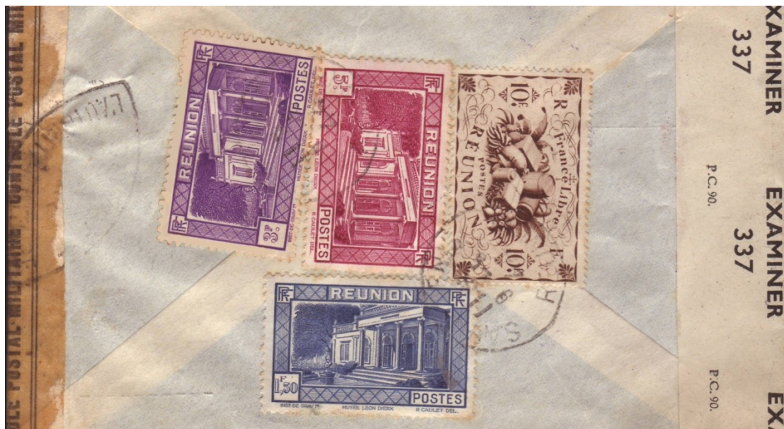
Lettre affranchie à 19f50.