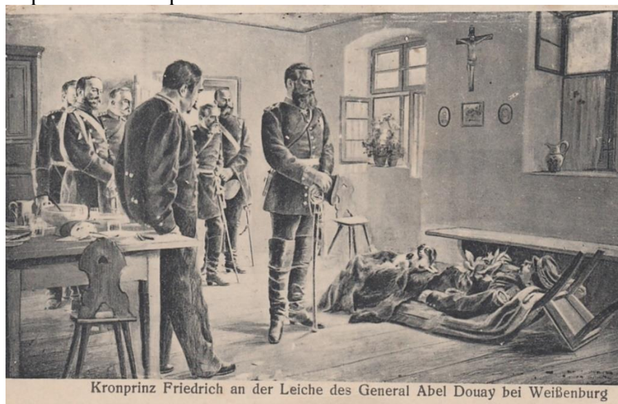
Kronprinz Friedrich an der Leiche des General Abel Douay bei Weißenburg

Arrivé sur les hauteurs du Geisberg, le général français n'aura pas eu le temps de commander ses troupes car il est très vite mortellement frappé par l'explosion de deux caissons de munitions et d'une mitrailleuse, touchés par l'artillerie prussienne.